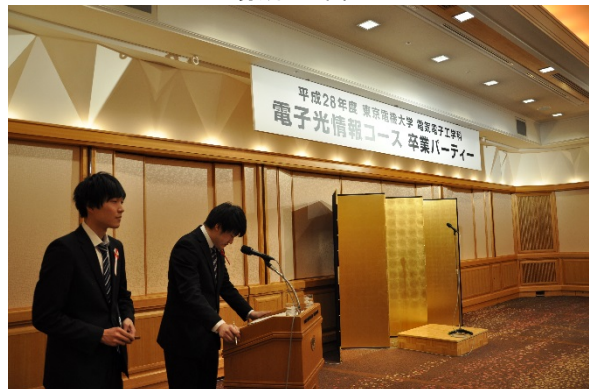
司会者として会の進行