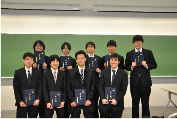
卒業式らしい1ショット