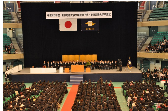
ついに式開始です