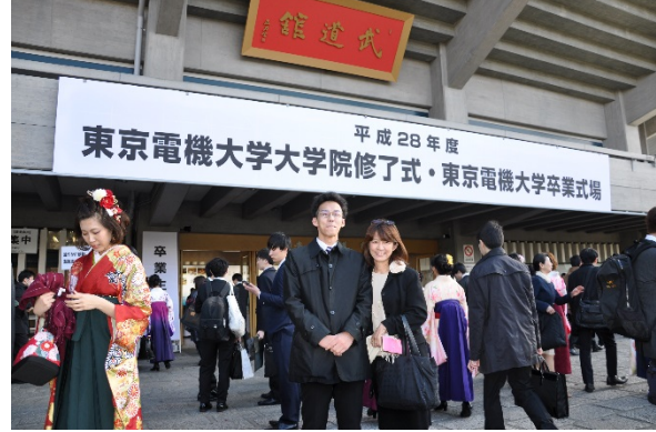
きれいなお姉さん、と1ショット