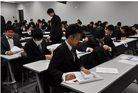
そして千住キャンパスに授与式です