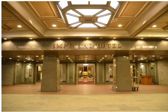
帝国ホテル入り口