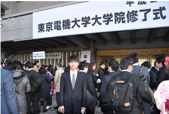
開場前は混みますな～