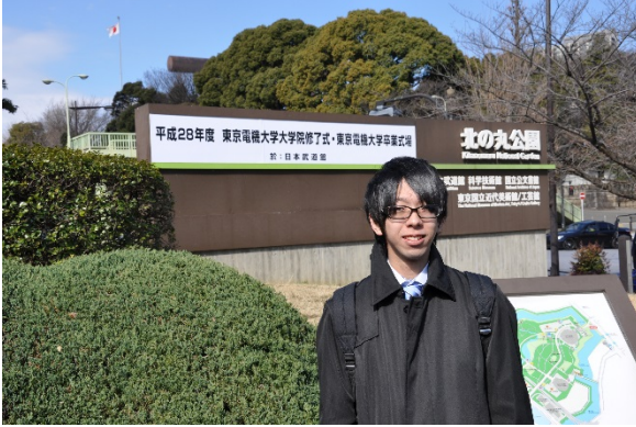
ゼミ生の1ショット