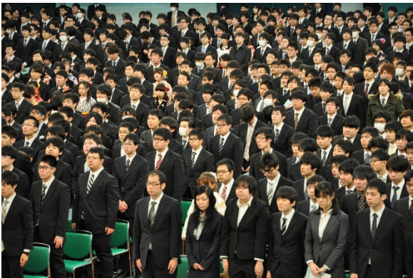
今年はバラけてます