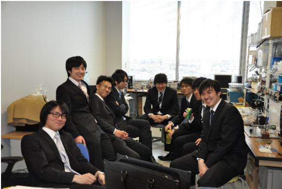
最後の研究室を堪能しました