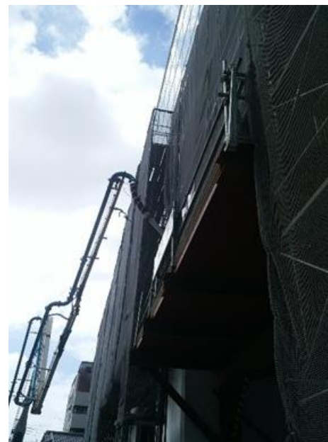
下から見た風景(入り口付近)