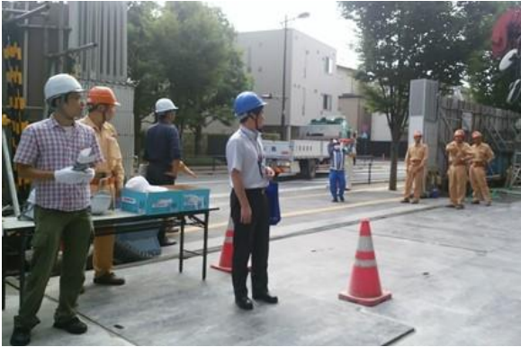
入り口でのヘルメット貸し出し