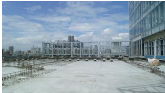
完成前のルーフガーデン（6階）の様子