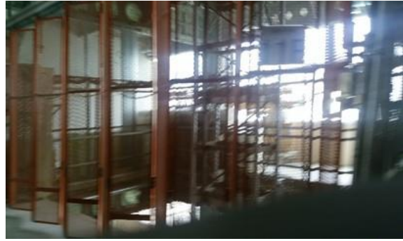
いざロングスパンエレベーター