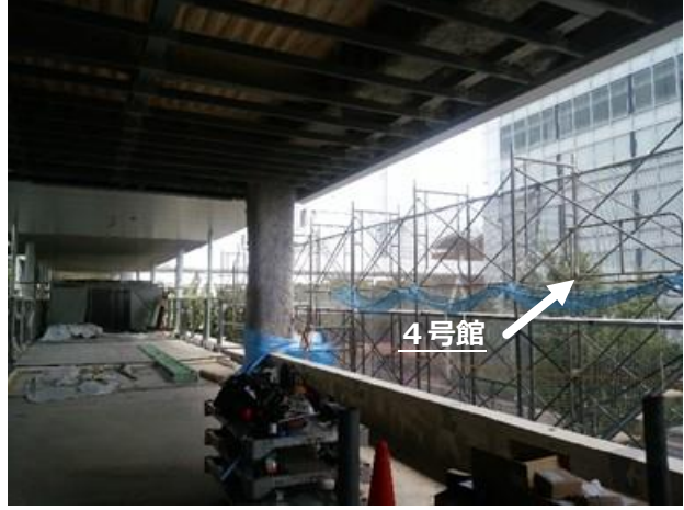
4号館（研究室の校舎）との連絡通路