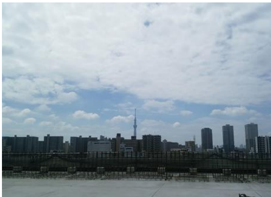
スカイツリーも見えます