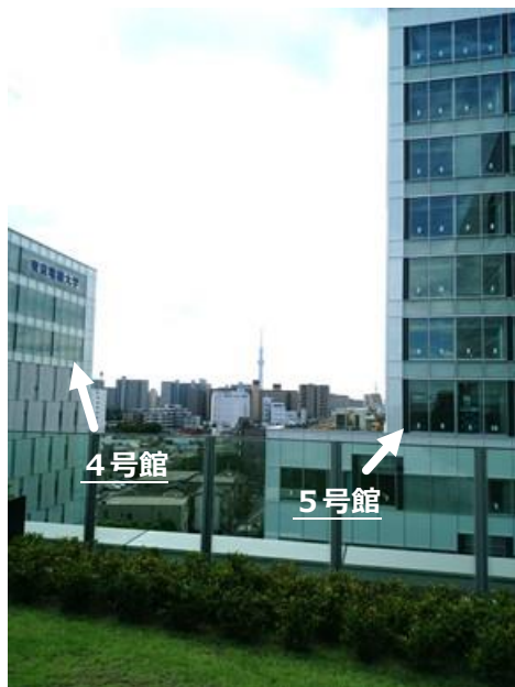
これが新校舎(5号館)です