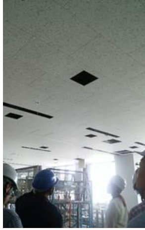
完成前と完成後の天井