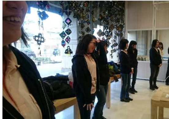
ユニフォームがガンギマってます