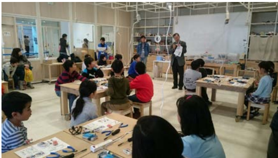
全体アナウンス中