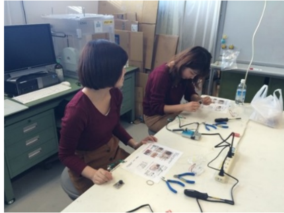
できた？ちょっと黙って