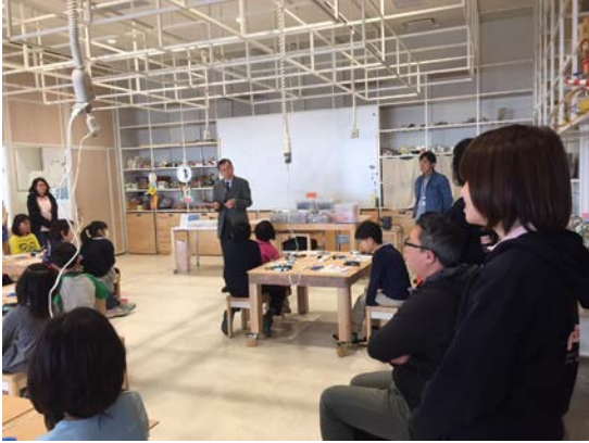
全体アナウンス継続中