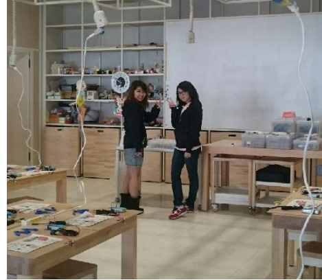
ガンギマリポーズ