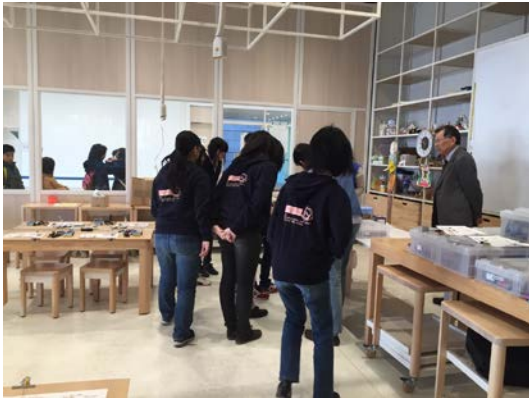
当日事前ミーティング中